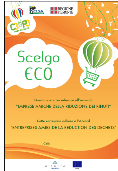
Attestato da parete